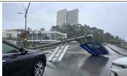
강릉 표지판 넘어짐