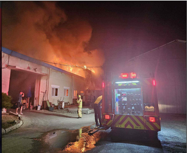
횡성군 목계리 공장화재