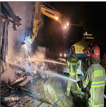
횡성군 서원면 주택화재