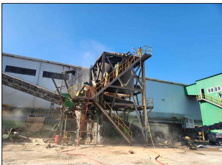
삼척 도계농공단지 화재