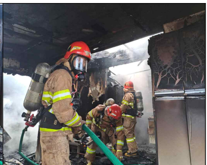
동해 이로동 주택화재2