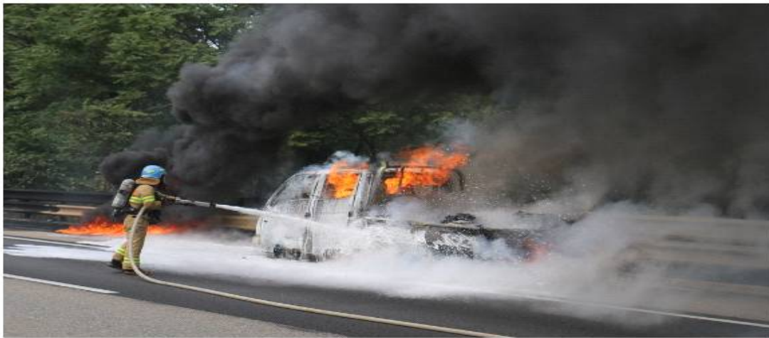
강원소방본부, 교통사고 안전 당부

(춘천=연합뉴스) 강태현 기자 = 거리두기 해제 이후 처음 맞는 추석 연휴를 맞아 소방당국이 교통사고 등 안전사고에 대비해 비상경계 근무를 강화한다.