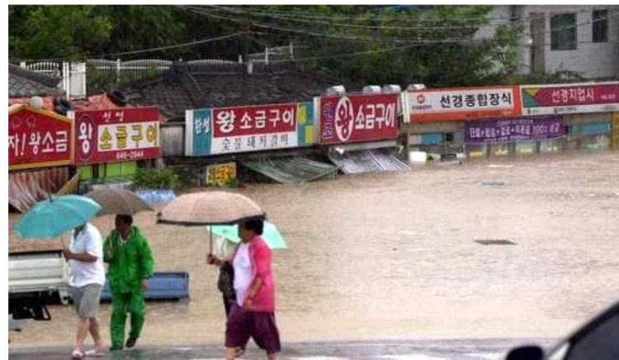
▲ 2002년 태풍 루사가 많은 비를 뿌린 강원 강릉시 모습.

뿐만 아니라 태풍 시에는 교통사고가 2배 이상 발생해 주의가 요구된다. 최근 3년간 도내 9월 하루 평균 교통사고 구조출동은 7.9건이었으나, 태풍의 영향권에 들었던 기간 중에는 일 평균 16.1건으로 2배 이상 사고 건수가 증가하는 모습을 보였다.