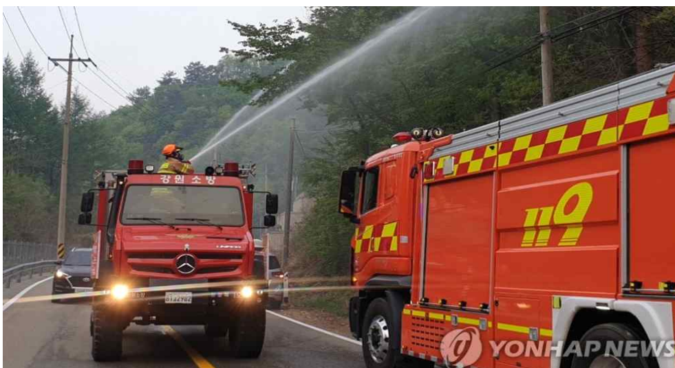
22일 오후 강원 양양군 현북면 일대에서 산불이 발생한 가운데 명지리에서 산불전문진화차량이 물을 뿌리며 진화작업을 하고 있다. 2022.4.22