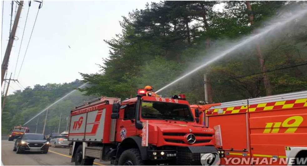
22일 오후 강원 양양군 현북면 일대에서 산불이 발생한 가운데 명지리에서 산불전문진화차량이 물을 뿌리며 진화작업을 하고 있다. 2022.4.22