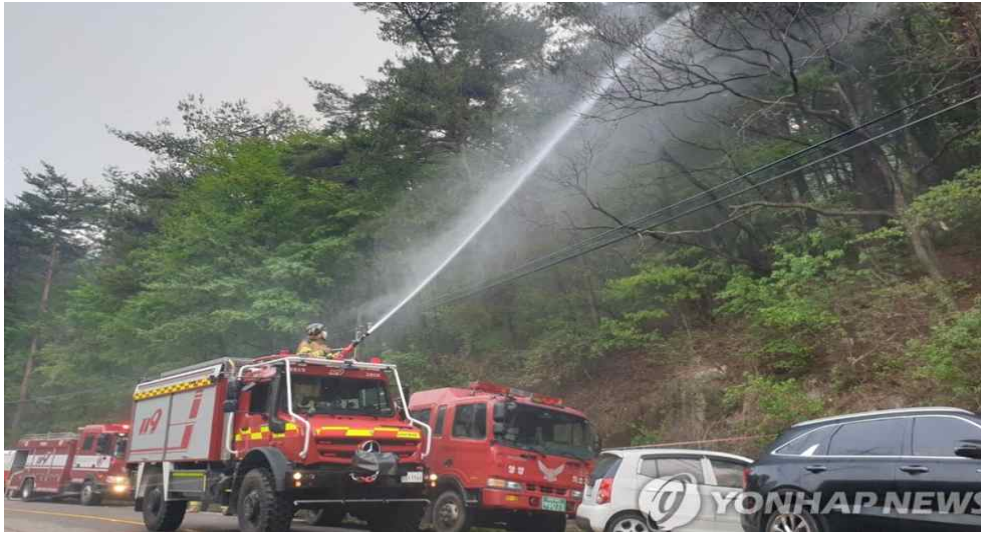
22일 오후 강원 양양군 현북면 일대에서 산불이 발생한 가운데 명지리에서 산불전문진화차량이 물을 뿌리며 진화작업을 하고 있다. 2022.4.22