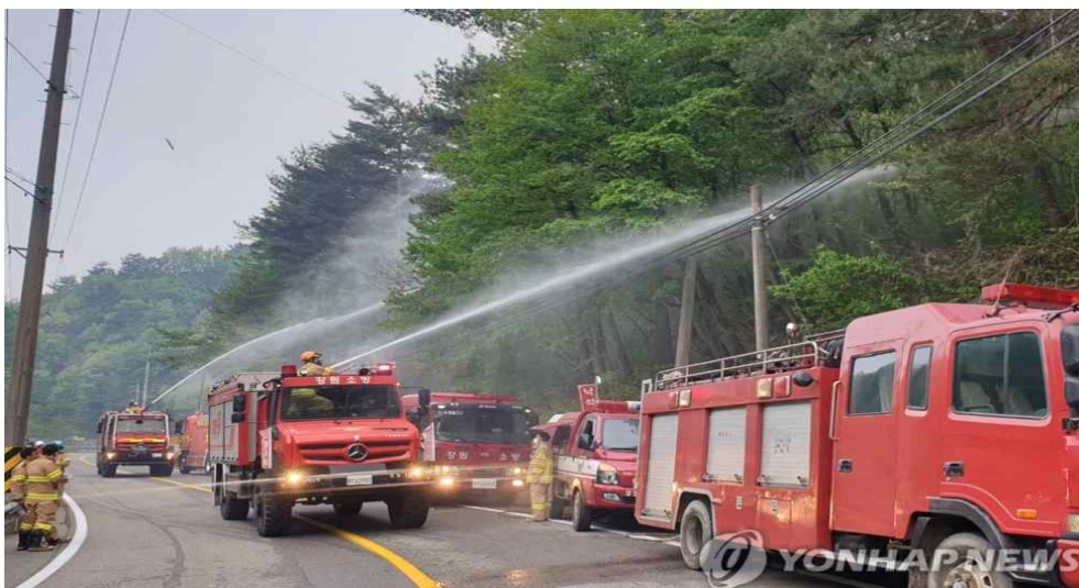
(양양=연합뉴스) 22일 오후 강원 양양군 현북면 일대에서 산불이 발생한 가운데 명지리에서 산불전문진화차량이 물을 뿌리며 진화작업을 하고 있다. 2022.4.22