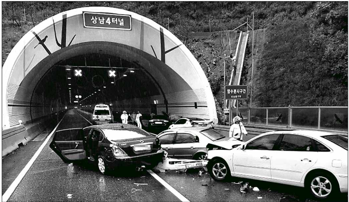
동서고속도로 차량 5대 연쇄 추돌 3일 오전 8시10분께 인제군 상남면 인근 동서고속도로 양양 방면 109.2km 지점 상남 4터널 입구에서 승용차 등 차량 5대가 연쇄 추돌해 6명이 다쳤다.

3일 오전 8시10분께 인제군 상남면 인근 동서고속도로 양양 방면 109.2km 지점 상남 4터널 입구에서 승용차 등 차량 5대가 연쇄 추돌했다. 이 사고로 승용차 운전자 등 6명이 다쳐 인근 병원으로 옮겨져 치료 중이다. 이날 오후 2시5분께에도 원주시 호저면 만종리 중앙고속도로 제천 방향 만종터널 인근에서 25인승 버스가 넘어졌다. 이 사고로 운전자 김모(54)씨 등 탑승객 6명이 다쳐 병원으로 옮겨졌다. 최기영·김천열기자