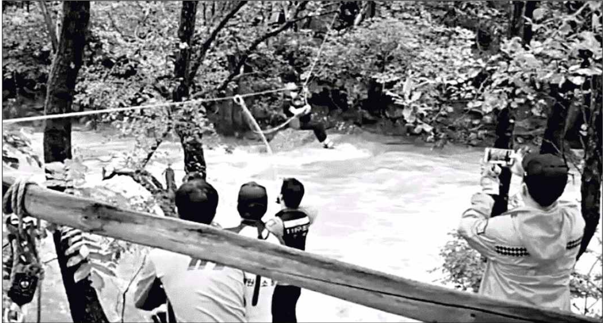
인제 계곡 고립자 구조 집중호우로 3일 오전 9시 31분쯤 인제 기린면 진동리 소재 연가리맑은터 계곡이 범람해 인제소방서 구조대원들이 로프를 이용해 고립된 3명을 구조하고 있다.