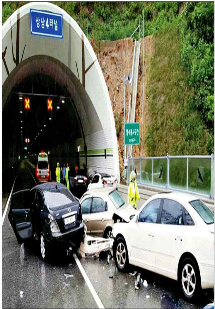
3일 오전 8시 10분쯤 서울~양양 동서고속도로 양양방향 상남4터널 입구에서 빗길 5중 추돌사고가 발생해 6명이 부상을 입었다.

장대비에 도로가 잠겨 홍천과 인제 지역 도로 5곳이 통제 및 우회조치됐다. 홍천은 내면 광원리 가덕교와 이일대 56번 국도, 남면 용수리 응야지나루터 군도 7호 등 3곳, 인제는 상남면 미산리 446번 지방도, 기린면 현리 하답산거리 31번 국도 등