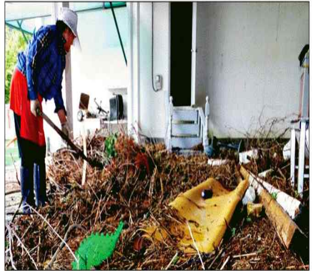
지난 2일 내린 집중호우로 인제 내린천 수위가 급격히 상승한 가운데 3일 기린면 서2리 마을 일부가 침수피해를 입었다. 한 민박집 주인이 건물에 쌓인 부유물을 치우고 있다. 최원명

평화의 댐으로 연결되는 화천 해산터널에서 집중호우로 인한 정전사고가 발생, 운전자들이 큰 불편을 겪었다. 도로관리사업소복부지사아 따르면 지난 2일 오전 9시쯤 집중 호우로 지방도 406호선 해산터널 송전선로에 나무가 쓰러져 정전사고가 발생했다. 이로 인해 3일 오후까지 터널 내 약 600개의 조명등을 밝히지 못했다. 이수영·최원명