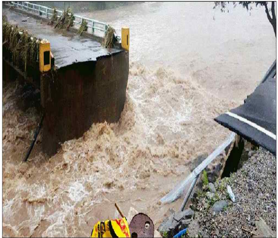
홍천군 내면 광원2리 지방도 446호 접속도로 교량인 가덕교가 3일 집중호우로 연결도로가 끊기면서 20가구 70여명이 고립됐다.

내면 광원2리 지역은 3일 시간당 50mm의 폭우가 쏟아지면서 가덕교의 지방도 446호 접속도로가 유실되면서 주