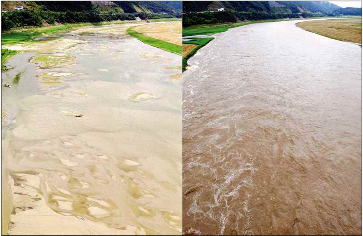
인제지역에 이틀동안 200mm 넘는 폭우가 쏟아진 가운데 3일 남전리 88대교 밑 소양호 상류가 가뭄 해갈을 알리듯 거대한 물길로 변했다. 지난달까지 극심한 가뭄으로 바닥을 드러낸 모습(사진 왼쪽)과는 대비된다. 최원명